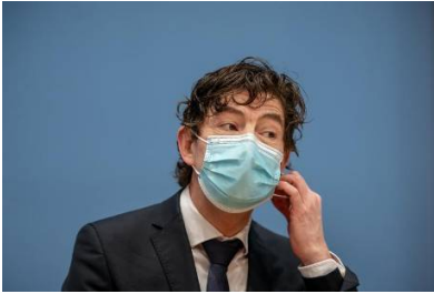
Christian Drosten: Impfen lassen - oder sich infizieren