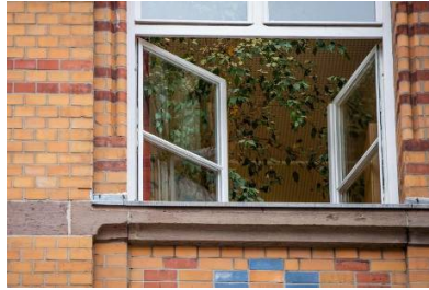
Aerosolforscher: Drinnen lauert die Gefahr